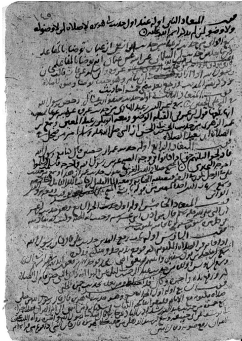
اللوحة رقم (٢)

أساء السامعين لسنن الدارقطني. مخطوطة المكتبة الوطنية بدمشق: ٣٠٨٣ت ١١: [٥٤١/أ]. وفيها يظهر كيف ضرب على فوات جميع سامعي الميعادين الرابع والسادس بكلمة أعيد بشكل مائل.