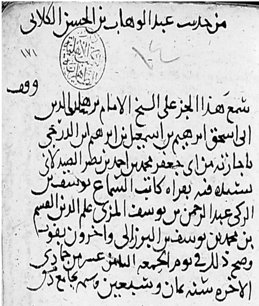
اللوحة رقم (٣)

أبو الحسين الكلابي، عبد الوهاب بن الحسن. أحاديث الكلابي. مخطوطة المكتبة الوطنية بدمشق. ٤٦٣ هـ: ٥١ [١٧١/أ]. وفيها طبقة سماع بخط أبي الحجاج يوسف بن الزكي عبد الرحمن بن يوسف المزي، وهو خلاف خط أوراق السماع لسنن الدارقطني.