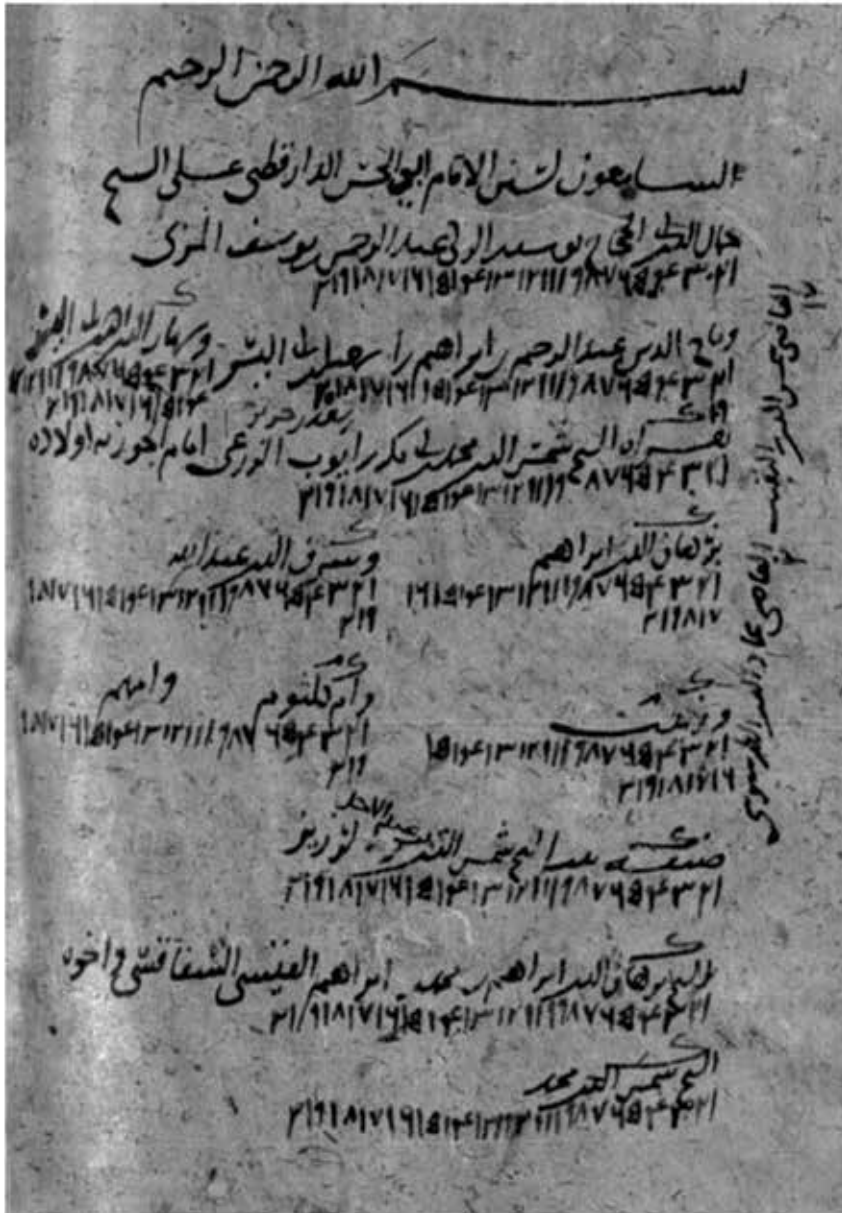
اللوحة رقم (١)

أسماء السامعين لسنن الدارقطني. مخطوطة المكتبة الوطنية بدمشق: ٣٠٨٣ ت ١١: [٦٣١/ب]. وفيها يظهر خط ضابط الأسماء، وهو ليس خط أبي الحجاج يوسف بن الزكي عبد الرحمن بن يوسف المزي. قارن مع اللوحة رقم (٣)، كما يظهر فيها الأرقام المستخدمة في تحديد المجالس التي سمعها كل مستمع، والرمزان ، ، .